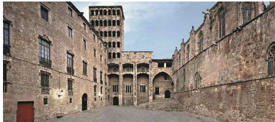
Plaça del rei