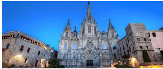
La catedral de Barcelona

Le marché le plus important et international de Barcelone.