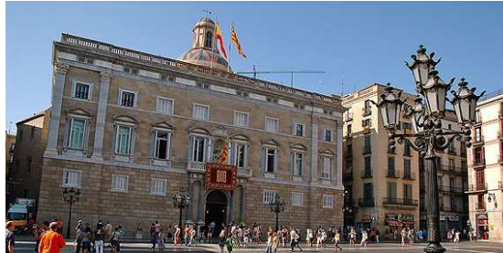
El Palau de la Generalitat